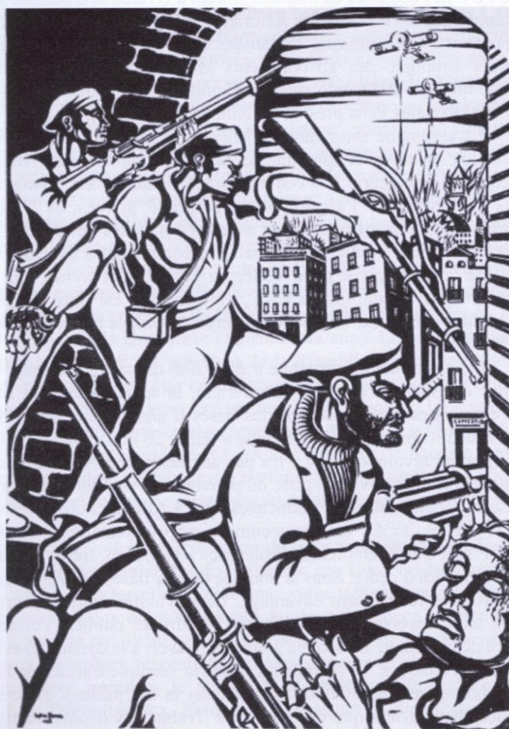
Dessin d'Hélio Gomez (Album « Viva Octobre », 1936) Légende du dessin : Mineurs et paysans des Asturies écrivent avec leur sang une page glorieuse.

« « L'octobre asturien » est devenu un symbole révolutionnaire et l'une des clés d'interprétation du « golpe » de juillet 1936 et de la Guerre d'Espagne. Pour les historiens révisionnistes et l'historiographie néoconservatrice, octobre 1934 marquerait en réalité la première bataille de la Guerre d'Espagne. Les socialistes, les anarchistes, la gauche, étaient prétendument disposés à en finir, par un coup d'Etat, avec un gouvernement légitime, avec la République, la démocratie, les institutions. La haine de classe conduit à des stratégies de guerre telle que celle du miroir, qui consiste à attribuer aux autres ses propres intentions... » Extrait de Octobre 1934 la « commune asturienne » par Jean Ortiz.